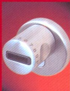
CodeLoxx CL mit Ziffernfeld & Chip-Schlüsselleser