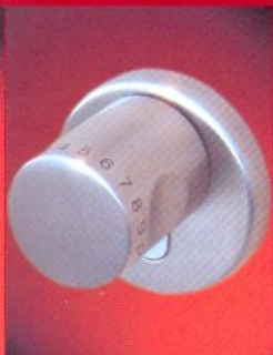
CodeLoxx C mit Ziffernfeld

Mit seinen 3 Varianten bietet SECCOR vom privaten Eigenheim bis hin zur großen Schließanlage im gewerblichen Objekt die optimale Lösung.