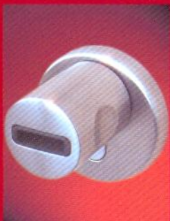
CodeLoxx L mit Chip-Schlüsselleser